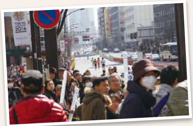
2016年 東京マラソンの様子