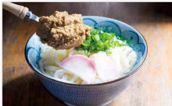
新鮮な魚を焼きほぐし、ペースト状にした「佐伯ごまだし」。うちの常備調味料です