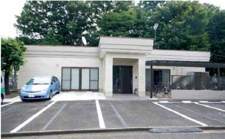
新天地！イコール新事務所

新事務所への移転が決定し、10年居たイコール旧事務所とはお別れになりました。さびしい気持ちもありますが、移転先でも、また新しい出会いが待っていることでしょう。次回は、事務所内の様子も紹介させていただきます。 (編集長)