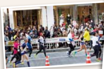
見慣れた都内がいつもと違って見えます