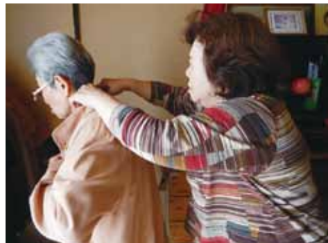
おひとりで難しいことは、一緒に