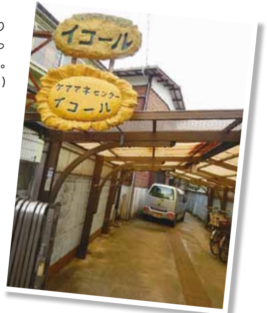
思い出の詰まった、イコール旧事務所