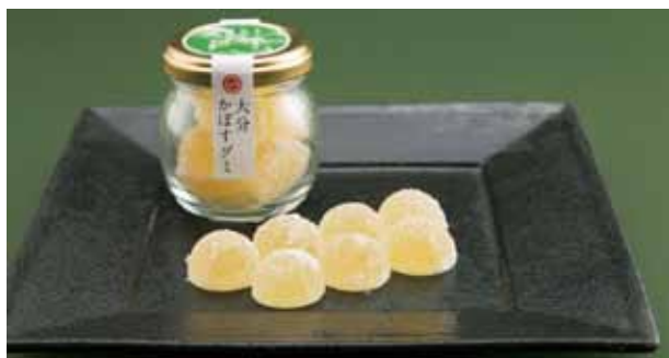
大分の食卓にかかせないかぼすをふんだんに使用した「大分かぼすグミ」

そんな大分ならではの品々を皆様にお届けし、大分の魅力をもっと広げようというプロジェクトが、私の勤めるNPOが運営する「Oita Made」です。メイドイン大分の食品・雑貨等を約60種ご用意しております。インターネットでも販売しておりますので、興味のある方は是非ご覧ください。（綾木）