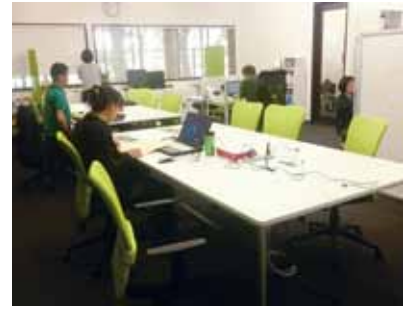
新事務所の平面図と内部の様子。

A 建築工事は細かな調整の積み重ねですが、そんな時に心が知れてるとトラブルも避けられる。アフターケアもすぐ来てくれる。あとはベストを尽くしてくれる。逆になんか逆引き交渉は出来ない(笑)