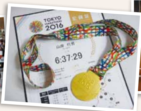
東京マラソン参加の証！