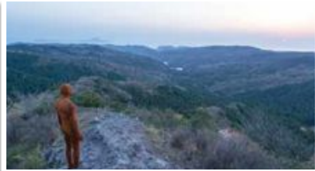
「ANOTHER TIME XX」 Antony Gormley 足元に広がる森と、その向こうに広がる海を眺めながら、何を想いますか。