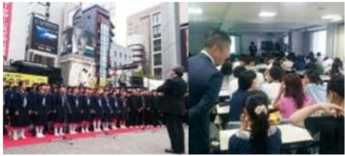
新橋で歌う福島の中学生