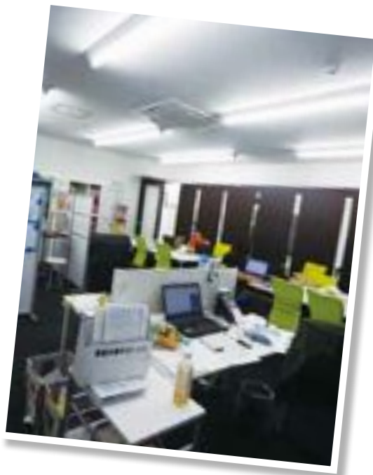
職務中の事務室の様子