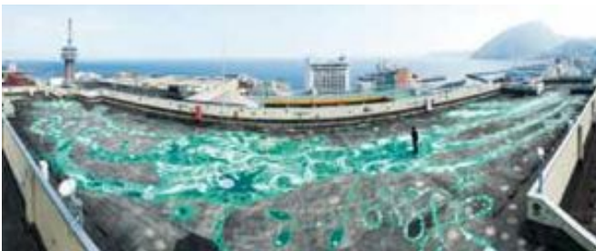
「海と山のあいだで生きている」 浅井裕介 巨大な生き物が百貨店の屋上に目いっぱい描かれている、 体感できるアートです。