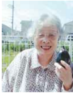
デイサービスで、ナスの収穫