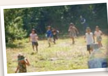
元気に走り回る子供たち