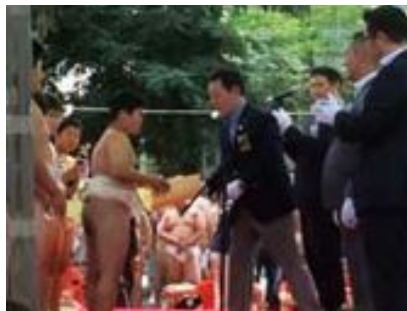
わんぱく東京都大会

Q イベント運営費はどこから出てくるんですか？ A 運営費は全て持ち出し。メンバーの会費と一部は協賛金です。ちなみに会長といつても無報酬だし、交通費も自腹。趣味に近いね。社会貢献できてるので、まあいいかなと。