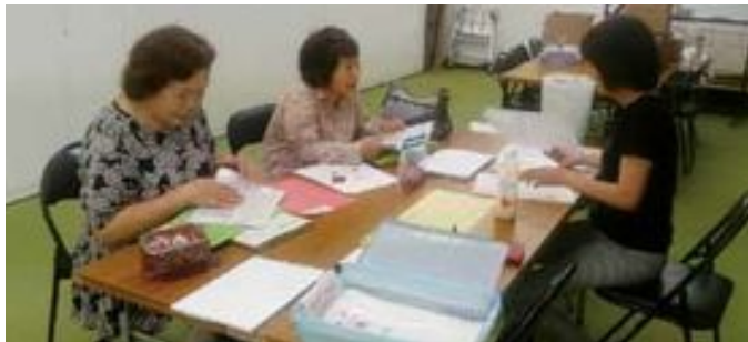
月末業務に多目的室を利用

事務室では固定席をなくし、状況に応じて空いている席を使う「フリーアドレス」を採用。より連携した業務を行えるようになりました。また、研修や月末業務で介護員が集まる際は、多目的室を利用しています。(編集長)