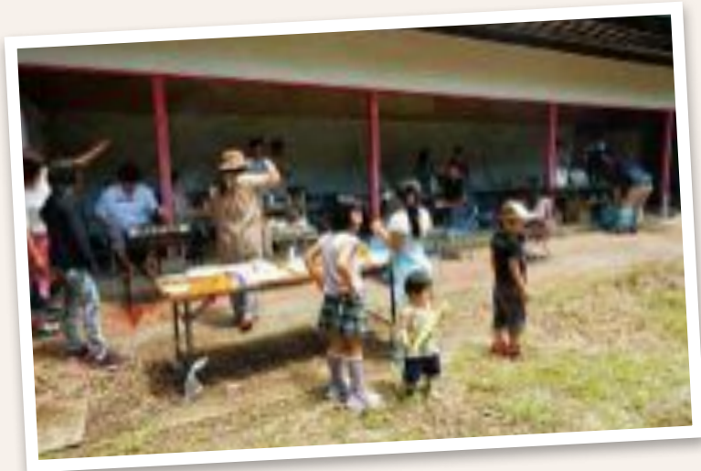
暑さに負けないバーベキュー！