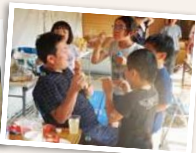
休憩中のひとコマ