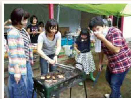
やっぱり、夏はバーベキュー！