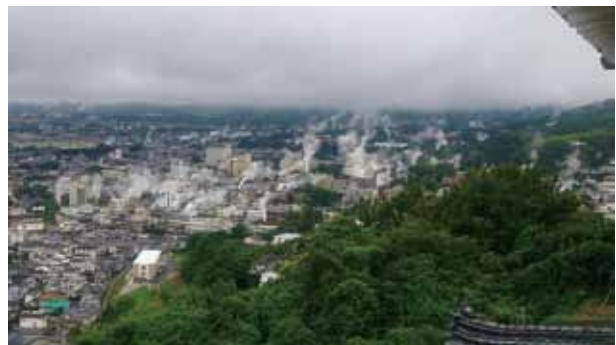
湯けむりの上がる鉄輪地域