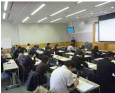
東京都協会の講座でゲスト講師に

A 物資などの直接的な支援は最近は無くて、風化防止とか教訓を防災に繋げる取組みが主ですね。例えば災害時に復旧の鍵となる市町村レベルでのボランティア受入れ機能の強化を進めています。あと、伊豆大島災害や青梅雪害の時は支援しましたし、鬼怒川氾濫でも現地の仲間が頑張ってます。支援しながら、今後に備えた枠組み作りを行っている感じですね。