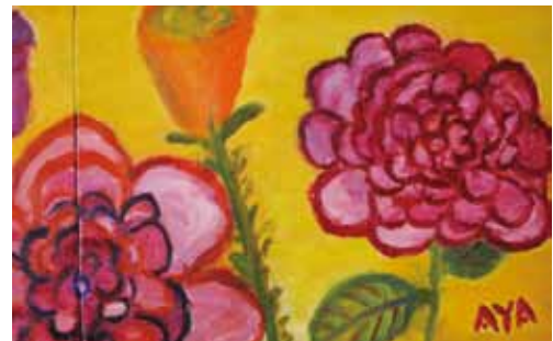
岡部さん独特の、色遣い

少々季節外れですが…。イコールでは、毎年7月にご利用者の方も交えて、皆でワイワイ、バーベキュー大会を開催しています。会場は、東和市内にある貯水池・鳥山さん。毎年一番楽しみにしてくれているのは子ども達で、森の中の広場で駆け回っています。大人も巻き込まれて時に泥だらけ。家族も一緒に楽しい1日です。