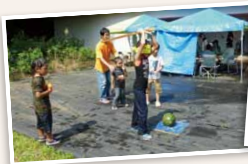
子ども達は元気にスイカ割り