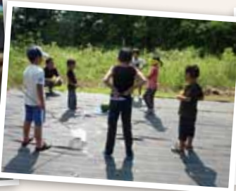
大人も子どもも「あっち！こっち！」と大騒ぎ