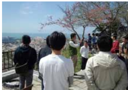
現状を学ぶための石巻へのスタディツアー