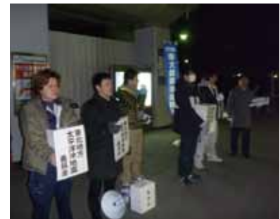
駅前で地元メンバーと義捐金募集