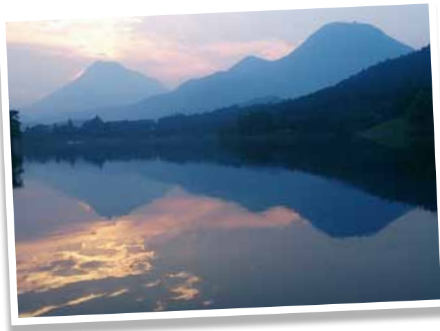
志高湖に映る由布岳と鶴見岳

また、海に面した扇状地を山々が囲み、頻繁に霧に囲まれます。もちろん海沿いの多湿な気候のせいもありますが、比喻ではなく、別府は町自体が温泉に浮かび、その湯気に包まれた町なのです。 (綾木)