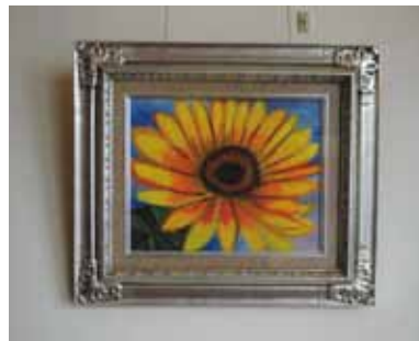
お気に入りのひまわりの絵