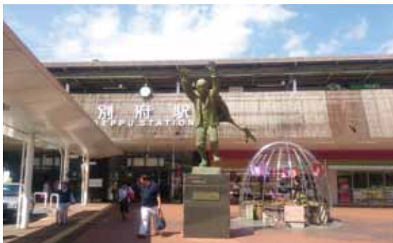
別府観光の父・油屋熊八の像